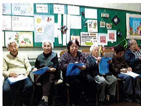
脳若返りプログラムの一風景です。

集計をしていて気付いたことは、もともとの点数が15点以上の方の点数の伸びがかなり大きく、もともとの点数が10点以下の方への効果は薄かったということです。 大切なのは、認知症予防を主体的に取り組んでいただくこと、なるべく早くに取り組んでいただくことです。 この脳若返りプログラムを行うにあたり、もっとも職員が心掛けていることは、“笑い”です。笑いこそもっとも大切な心のリハビリなのかも知れませんね。